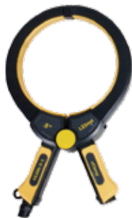
50mm, 100mm, 125mm Indukční kleš