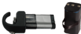
Přijímač / Vysílač blok akumulátor