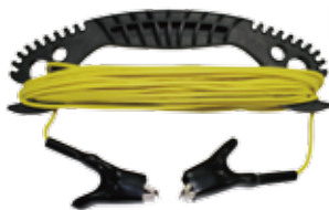
Prodlužovací zemní kabel