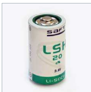
SAFT lithiová baterie Číslo dílu 820007318