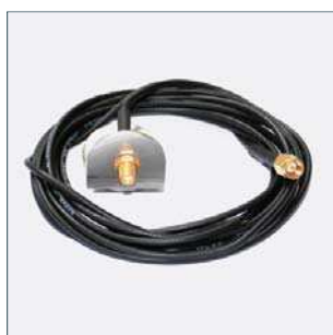
Prodlužovací anténní kabel (3 m) Číslo dílu 2011249