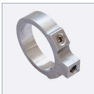
Prstenec pro upevnění magnetu (volně nastavitelný v rozsahu 360°) Číslo dílu 2015069