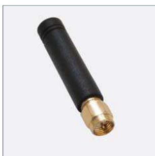
Prutová anténa Číslo dílu 90035958