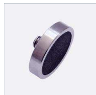
Magnetický adaptér (automaticky dodáván s každým záznamníkem SmartEAR) Číslo dílu 820015167