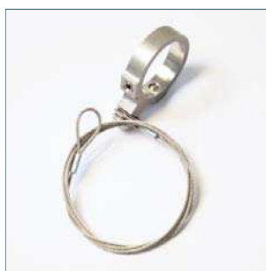
Zabezpečovací ocelové lanko s prstencem pro upevnění magnetu Číslo dílu 2015049