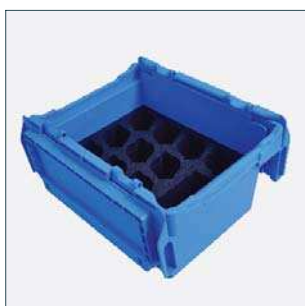
Přepravní box s prostorem pro 10 záznamníků SmartEAR a a přihrádkou na příslušenství Číslo dílu 2014649