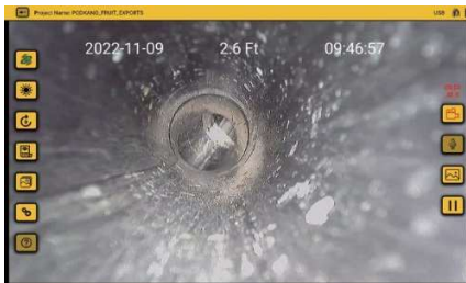
Aplikace VMC - ovládání všech funkcí

Navigák je napájen interními Li-ion akumulátory, které poskytují stálý a čistý výkon s dlouhou životností. Šestihodinové nabíjení zajistí až 12 hodin napájení při přerušovaném používání lokalizační sondy.