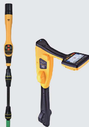
VM-540 a vLoc3D-Cam